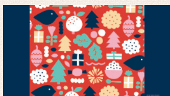
11-12月 Leena Kisonen