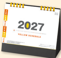
SB-327 卓上イエロースケジュール