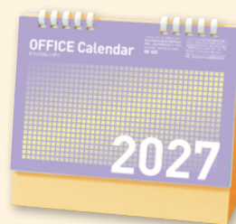
SB-322 オフィスカレンダー