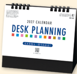
SB-320 デスクプランニング