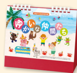
SB-350 卓上ゆかいな仲間たち