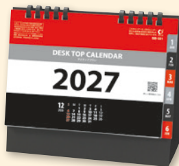
SB-321 アクティブプラン