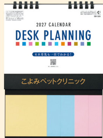
お届け時の状態 (名入れイメージ)