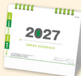
SB-328 卓上グリーンスケジュール