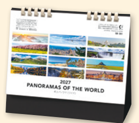
SB-351 卓上パノラマ〔ワイド〕